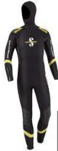
Combinaison Semi étanche